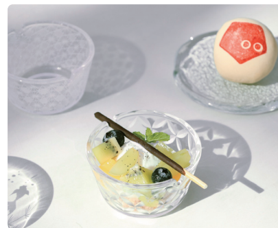
カフェ「春室」食器 南美春室 THE POOL (台湾のガラスメーカーが運営するカフェ) × 山田硝子