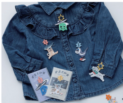
BUTTON HOOK「すみだ×台南」 AXXY COOL (台南市のイラストレーター) × オレンジトーカー