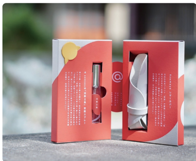
台南の香り×すみだレザー N senses (台湾のアロマブランド) × 東屋